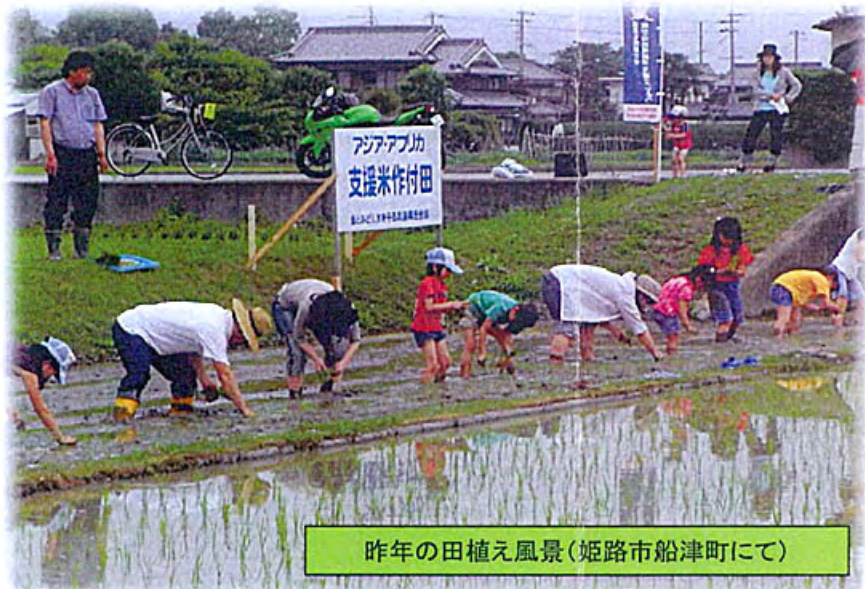
昨年の田植え風景(姫路市船津町にて)